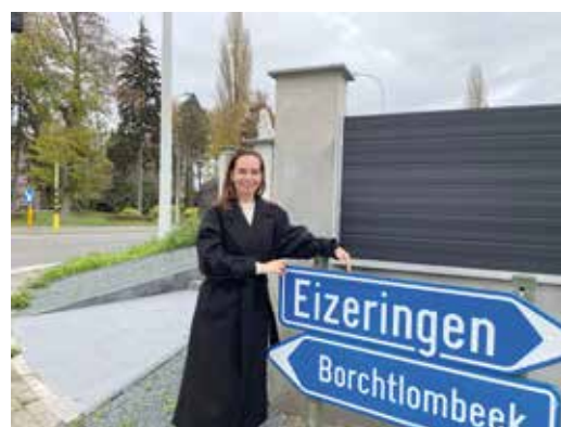
Eizeringen is een dorp. Wij zien hier liever geen hoogbouw.